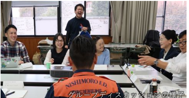
グループディスカッションの様子

内容：ワークショップ（模擬症例をもとにしたグループディスカッション） 自傷・自殺未遂症例，過換気症例，幻覚妄想症例，違法薬物使用症例 対象者：高千穂保健所圏域の救急医療・精神科医療に従事する医療関係者全般 （医師，看護師，救急隊員，ソーシャルワーカー，心理士，保健師など）