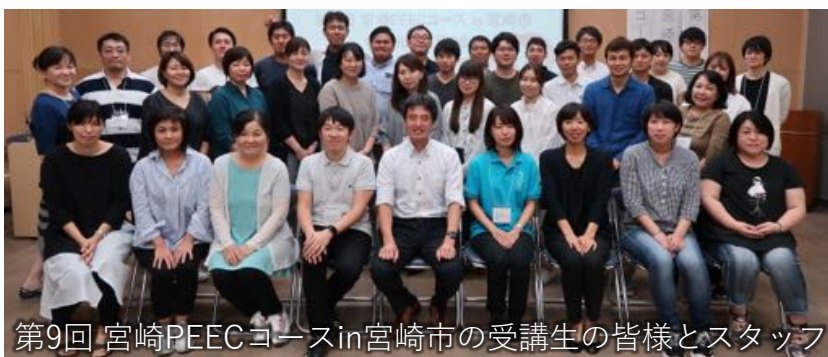
第9回 宮崎PEECコースin宮崎市の受講生の皆様とスタッフ

単位：日本医師会生涯教育講座 8単位（CC:13，CC:68，CC:69，CC:70） 産業医研修会 3単位（生涯研修の専門研修 4 メンタルヘルス対策）