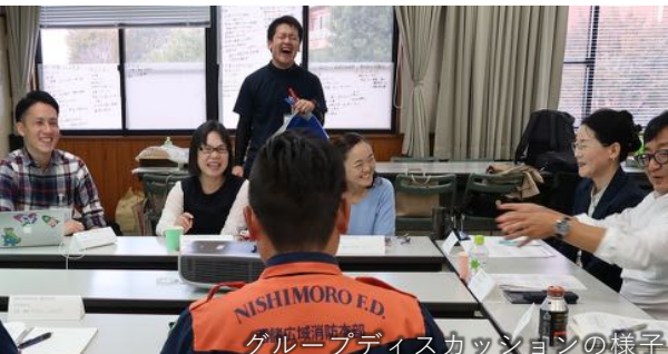
グループディスカッションの様子

内 容：ワークショップ（模擬症例をもとにしたグループディスカッション） 自傷・自殺未遂症例，過換気症例，幻覚妄想症例，違法薬物使用症例 対象者：日南保健所圏域の救急医療・精神科医療に従事する医療関係者全般 （医師，看護師，救急隊員，ソーシャルワーカー，心理士，保健師など）