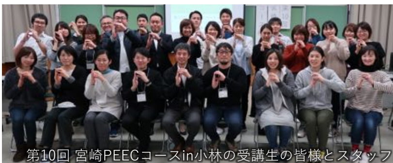
第10回 宮崎PEECコースin小林的受講生の皆様とスタッフ

単 位：日本医師会生涯教育講座 8単位（CC:13，CC:68，CC:69，CC:70） 産業医研修会 3単位（生涯研修の専門研修 4 メンタルヘルス対策）