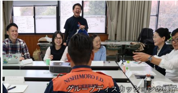
グループディスカッションの様子

内容：ワークショップ（模擬症例をもとにしたグループディスカッション） 自傷・自殺未遂症例，過換気症例，幻覚妄想症例，違法薬物使用症例 対象者：小林保健所圏域の救急医療・精神科医療に従事する医療関係者全般 （医師，看護師，救急隊員，ソーシャルワーカー，心理士，保健師など）